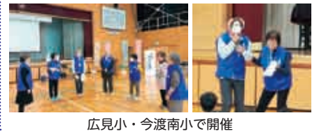
広見小・今渡南小で開催

・標語 (25周年)、300字小説 (18周年) ・ぬくもり教室 (14周年) ・人権本巡回 (17周年) 70冊×2コース全小学校巡回