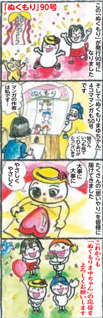
(当センター事務局長による作品です)